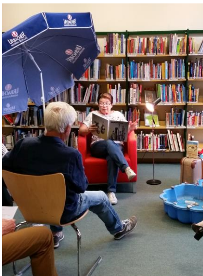
„Sommerfrische“ im Lese-Treff

Grundschulkindern allerhand Wissenswertes und Kurioses über den Alltag der Menschen in der antiken Großstadt.