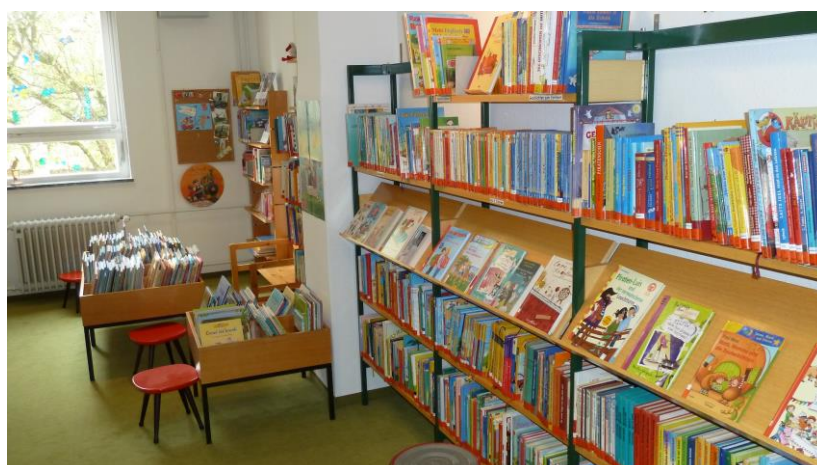
Ortsbücherei im Rathaus Weiler

Um während der Renovierung der Stadtbücherei eine Alternative zu bieten, hatte die Ortsbücherei im November 2016 zusätzlich dienstags bis freitags von 15 bis 18 Uhr geöffnet. Im Jahr 2016 kamen knapp 1.900 Besucher in die Ortsbücherei.