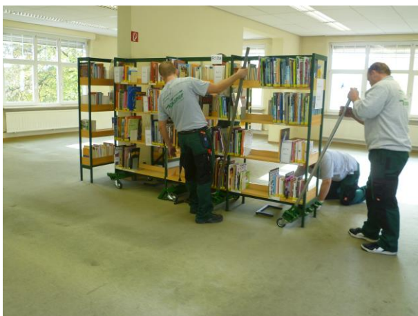
Beim Ausräumen der Kinderabteilung

Fachbereiche ausgestattet. Die zwei verbliebenen Büros im sollen 2017 folgen. Aufgrund dieser Arbeiten hatte die Stadtbücherei vom 27. Oktober bis 5. Dezember geschlossen. Großzügige Ausleihbedingungen motivierten die Leserschaft zum Ausleihen. Mit Erfolg: Im November war 70% der Kinder- und Jugendliteratur entliehen, 60% der Sachbücher, 40% der Romane und 80% der Kinder-CDs. Nutzer und Beschäftigte freuten sich im Dezember über die Verbesserungen.