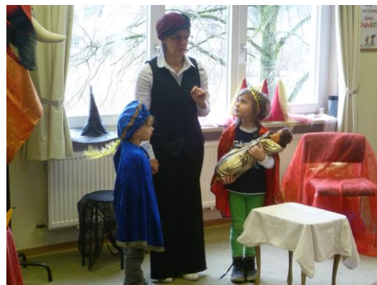
Märchen für Grundschüler

Die Stadtbücherei engagiert sich stark in der Leseförderung. 2016 erhielten mehr Kinder eine Einführung als je zuvor. Zwei besondere Führungsprojekte sprechen die Kinder altersgerecht an: „Leseprofi – Klasse drei in die Bücherei!“ für die dritten Klassen und „Löwenstark durchs Alphabet“ für die Vorschulkinder der Kindergärten. 19 Kindergartengruppen und 15 Schulklassen nahmen teil.