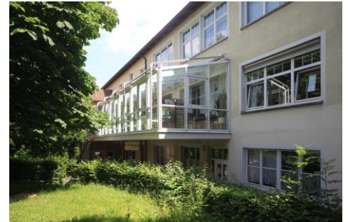
Leseterrasse der Stadtbücherei

wurde 1949 gegründet. 1986 erhielt sie mit dem Anbau der Leseterrasse ihre heutige Fläche und die bis heute genutzte Möblierung und Ausstattung. Sie verfügt über 6,5 Personalstellen und bis zu zwei Ausbildungsplätze für den Beruf der/des Fachangestellten für Medien- und Informationsdienste (Fachrichtung Bibliothek). Mit der Ortsbücherei im Rathaus Weiler hat Schorndorf eine zweite kommunale Bibliothek. Im Folgenden werden die Zahlen beider Bibliotheken getrennt betrachtet.