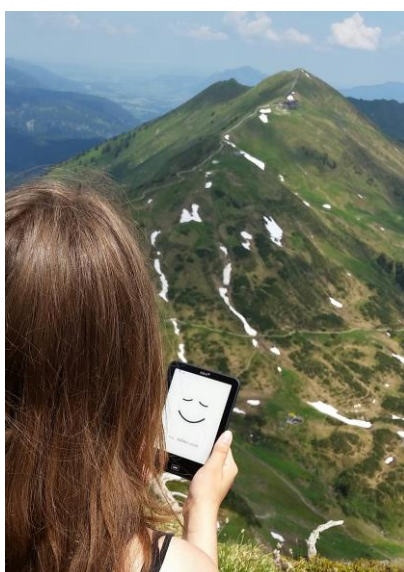
Mit dem eBook im Urlaub

Alle hauptamtlich geleiteten öffentlichen Bibliotheken des Rems-Murr-Kreises beteiligen sich inzwischen an der 2012 gegründeten „eBibliothek Rems-Murr“. Auf www.ebibliothek-rem-s-murr.de bieten sie eBooks, eAudios, ePapers, eMagazines und eVideos zum Herunterladen an. Diese Medien können am PC, eBook-Reader oder einem anderen kompatiblen Endgerät wie Smartphone oder Tablet genutzt werden.