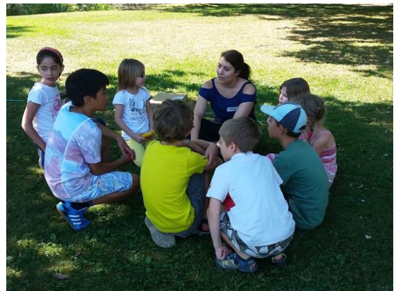
Bibliotheksolympiade im Stadtpark

Einen großen Anteil an den Veranstaltungen haben die erwähnten Leseförderungsangebote (siehe 5.) der Kinderabteilung. Hierzu zählte auch der Sommerleseclub „HEISS AUF LESEN - Junior“ und ein Sams-Abend im Rahmen des Schorndorfer Ferienprogramms. In den Sommerferien konnten sich Kinder einer Bibliotheksolympiade mit verschiedenen Wettkämpfen und Disziplinen stellen. Neu ist das Format „Bastelwerkstatt“ für Kinder zwischen 5 und 8 Jahren. Viermal im Jahr können die jungen Teilnehmer ein Programm aus Vorlesegeschichte, Spiel und Basteln erleben.