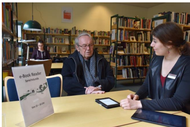
Beratung bei der eBook-Sprechstunde

Der Bestand wuchs um 15 % auf 14.580 Titel zum 31.12.2017. Der Schorndorfer Kostenanteil für Neuanschaffungen und Betriebskosten des Onleihe-Anbieters DiViBib belief sich auf 6.500 Euro. Kunden mit einem Ausweis der Schorndorfer Stadtbücherei entliehen 22.930 Medien.