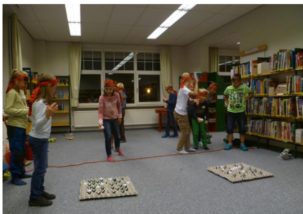
Piratennacht in den Sommerferien

Einen großen Anteil an den Veranstaltungen haben die erwähnten Leseförderungsangebote (siehe 5.) der Kinderabteilung. Hierzu zählte auch der Sommerleseclub „HEISS AUF LESEN“ und ein Piraten-Abend im Rahmen des Schorndorfer Ferienprogramms. In der „Bastelwerkstatt“ für Kinder zwischen 5 und 7 Jahren wird viermal im Jahr das Thema eines Buches kreativ umgesetzt. Im Oktober fand erstmals ein „STAR WARS Reads Day“ statt mit Spielen, Bastelangebot und Leseabend.