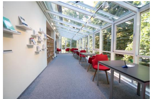
Leseterrasse der Stadtbücherei

wurde 1949 gegründet. 1986 erhielt sie mit dem Anbau der Leseterrasse ihre heutige Fläche und die bis heute genutzte Möblierung und Ausstattung. Sie verfügt über 6,5 Personalstellen und bis zu zwei Ausbildungsplätze für den Beruf der/des Fachangestellten für Medien- und Informationsdienste (Fachrichtung Bibliothek). Mit der Ortsbücherei im Rathaus Weiler hat Schorndorf eine zweite kommunale Bibliothek. Im Folgenden werden die Zahlen beider Bibliotheken getrennt betrachtet.