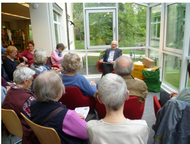
Offener Lese-Treff zum Thema „Briefe“

Auf Initiative des Familienzentrums Schorndorf unterstützt die Stadtbücherei als sogenannter „Zweiter Bündnispartner“ das Projekt „Leseclubs – mit Freu(n)den lesen“ der Stiftung Lesen. Seit 2006 lesen ehrenamtliche Vorlesepaten Kindern in offenen Kleingruppen vor. Zu den 24 Vorlesestunden kamen 128 Kinder.