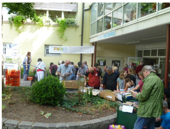
Bücherflohmarkt des Freundeskreises im Juli 2018

Dank der Unterstützung der „Freunde der Stadtbücherei Schorndorf e.V.“ kann die Bibliothek seit 2015 Kinder- und Gesellschaftsspiele verleihen. Mit einer erneuten Spende hat der Verein das Angebot 2017 aktualisiert. Er kaufte 62 neue Spiele im Gesamtwert von 1.500 Euro. Nun haben die Entleiher 204 Spiele zur Auswahl, die Nachfrage ist groß. In zwei Veranstaltungen stellte der Verein zusammen mit einer Bibliotheksmitarbeiterin neue Spiele vor.