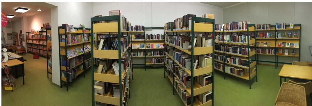
Ortsbücherei im Rathaus Weiler

5.000 Bücher, CDs und DVDs ausgeliehen. Der Medienbestand liegt bei 5.900 Exemplaren, davon sind 3.400 Kinder- und Jugendbücher, 2.100 Romane, 200 Sachbücher, 240 Kinder-CDs und 32 DVDs. Regelmäßig werden veraltete und kaputte Medien ausgesondert. Laufende Neuanschaffungen halten das Angebot aktuell, so kamen 2018 250 neue Medien hinzu. Im vergangenen Jahr haben sich 53 neue Leser angemeldet. Sechs Schulklassen der Reinhold-Maier-Schule kamen zu einer Klassenführung in die Bücherei. Die Erstklässler wurden von „Henri, dem Bücherdieb“ besucht, der den Kindern eine Bücherei erklärte und die Ortsbücherei empfahl! Die Ortsbücherei ist jeden Donnerstag von 15 bis 18 Uhr geöffnet.