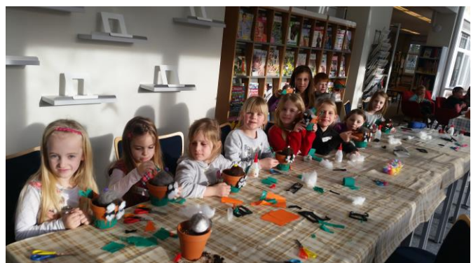
Bastelnachmittag in der Stadtbücherei

Die Bibliothek arbeitet vernetzt und nutzt Synergien. Dies gelingt im Rahmen mehrerer Kooperationen. Zum neunten Mal veranstaltete die Stadtbücherei gemeinsam mit der Sektion Literatur des Kulturforums Schorndorf eine literarische