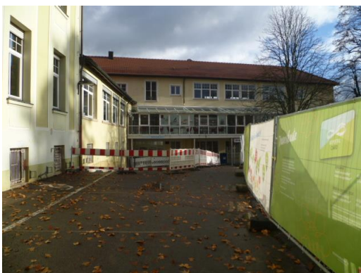
Stadtbücherei im Winter 2018

wurde 1949 gegründet. 1986 erhielt sie mit dem Anbau der Leseterrasse ihre heutige Fläche und die bis heute genutzte Möblierung und Ausstattung. Sie verfügt über 6,5 Personalstellen und ein bis zwei Ausbildungsplätze für den Beruf der/des Fachangestellten für Medien- und Informationsdienste (Fachrichtung Bibliothek). Mit der Ortsbücherei im Rathaus Weiler hat Schorndorf eine zweite kommunale Bibliothek. Im Folgenden werden die Zahlen beider Bibliotheken getrennt betrachtet.