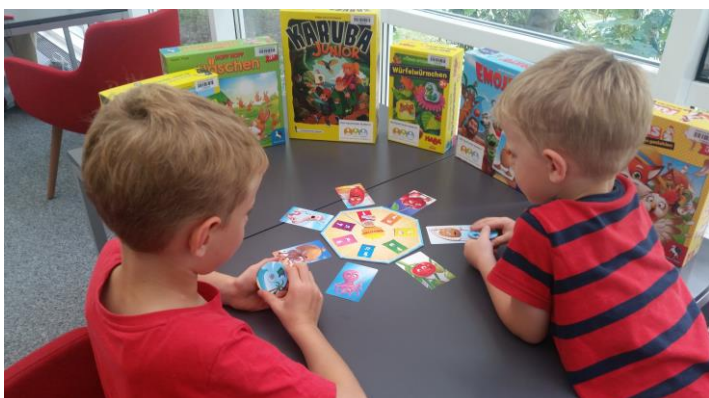
Der Förderverein spendete 74 neue Spiele

Dank der Unterstützung der „Freunde der Stadtbücherei Schorndorf e.V.“ kann die Bibliothek seit 2015 auch Kinder- und Gesellschaftsspiele verleihen. Mit einer erneuten Spende hat der Verein das Angebot 2018 weiter ausgebaut. Er kaufte 74 neue Spiele im Gesamtwert von 2.000 Euro. Nun haben die Entleiher über 300 Spiele zur Auswahl, die Nachfrage ist groß. In drei Veranstaltungen stellte der Verein zusammen mit einer Bibliotheksmitarbeiterin neue Spiele vor.